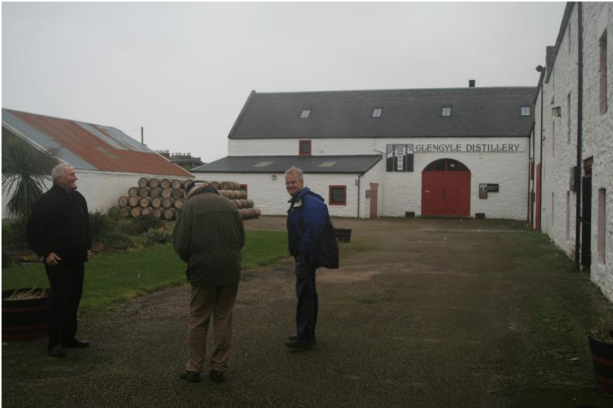
Hazelburn år 2008

TACK till alla som medverkade på årets whiskyresa. Äntligen fick man träffa lite fågelskådare in real life och lyfta kikaren. Provingen digitalt flöt ju på mycket bra. Det blev en annorlunda resa 2021, men 2022 hoppas vi på en mer normal resa då vi kan ses nere i Skåne Tranås igen och njuta av lite mat och whisky under vanliga former. Jag planerar att resan 2022 sker helgen 15 – 16 januari.