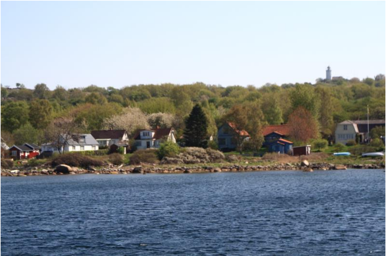
Hanö i maj 2013

Väder: Växlande molnighet med några lätta regnstänk på lördagen. Temperaturen varierade från 12° till 21 °C och svag V vind (2-3 m/s), något ökande på söndagen.